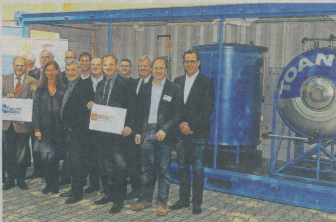
Unternehmer haben eine Wasseraufbereitungsanlage gespendet.

Auch den Nachwuchs in seinem Unternehmen bindet Hülsemann mit ein. „Einige unserer internen Projekte haben eine Ei-